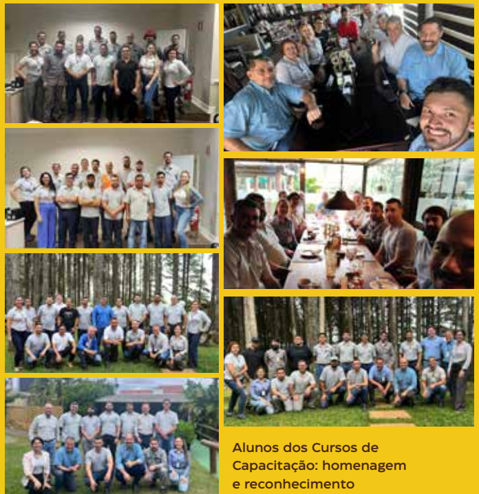
Alunos dos Cursos de Capacitação: homenagem e reconhecimento

Este compromisso com a inovação e a capacitação mostra o empenho da empresa em manter-se sempre à frente, não apenas em suas operações, mas também no desenvolvimento humano.